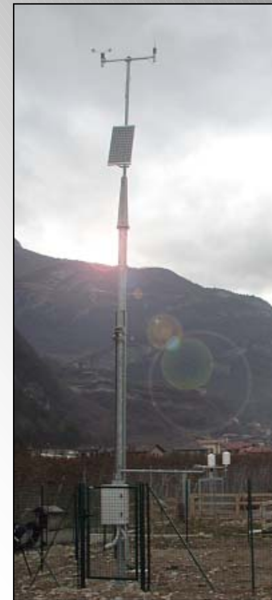
Palo ribaltabile 10 m ad uso meteorologico certificato con sicurezze Certificatted meteorological 10 m tip up pole with secure