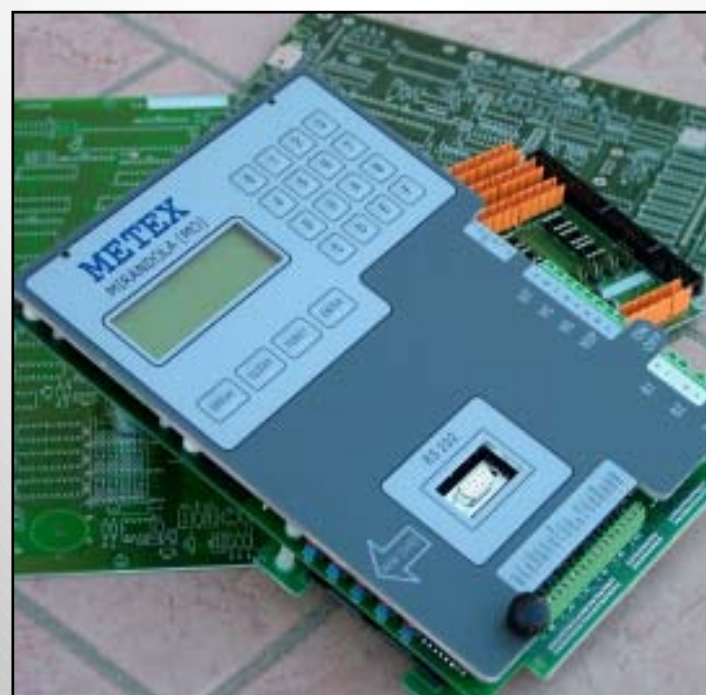
Elettronica di acquisizione programmabile AS18 AS18 programmable datalogger

Ulteriori approfondimenti relativi al panorama completo di dispositivi e sensori disponibili, potrà essere richiesto direttamente alla METEX oppure, in alternativa, consultando il sito internet dell'azienda.