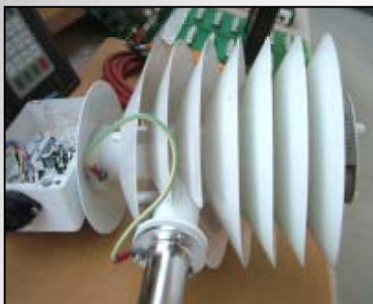
Riparazioni in laboratorio Internal repairing