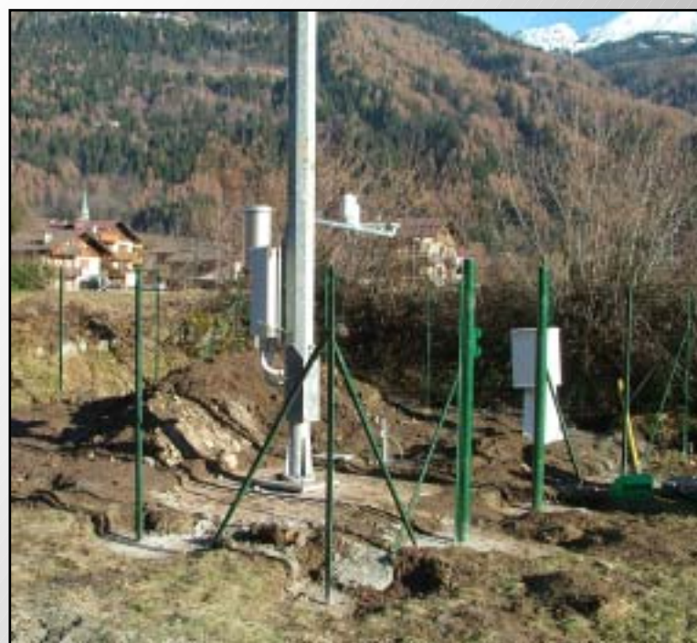
Nuove installazioni - New installations