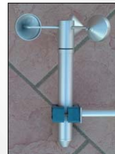
Anemometro a coppe Cup anemometer