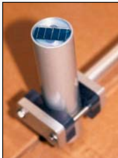
Produzione - Production

METEX si colloca in una posizione di mercato trasversale: a prezzi competitivi è in grado di offrire elevata qualità dei prodotti e flessibilità nei servizi.