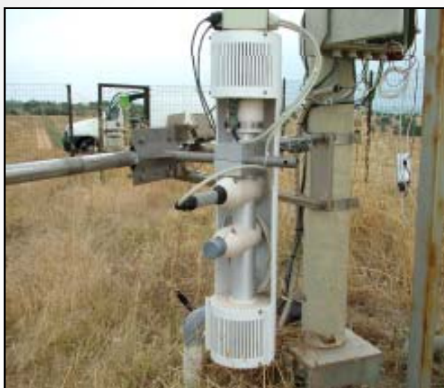
Manutenzioni in campo - On site servicing