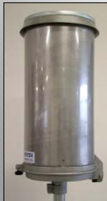
Pluviometro - Rain gauge